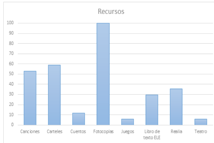
Figura 1. Recursos

Desde el punto de vista de la multimodalidad, el 100% de los docentes incorporaba materiales impresos, y en menor medida, recursos tales como canciones, cuentos, carteles, teatro, etc. Y en cuanto a la disponibilidad de herramientas tecnológicas, el 94,1% poseía ordenador con conexión a internet, aunque sólo el 88,2% tenía proyector y altavoces. De todos ellos, únicamente el 17,6% contaba con una pizarra digital.